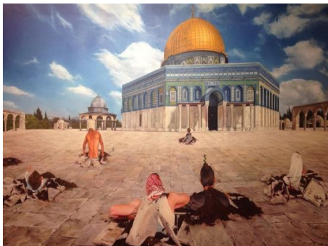
Underground evolution 2 – Shadi Alzaqouq, peintre (Gaza)