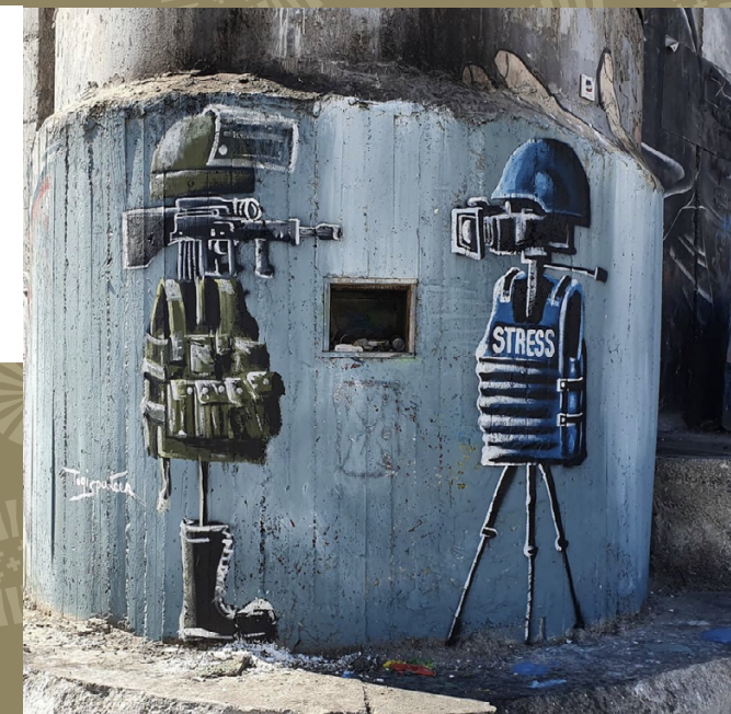
Fresque sur le Mur de l'apartheid, de l'artiste Taqi Spateen, à Bethléem