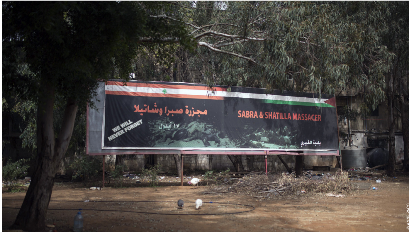
Un mémorial en hommage aux victimes du massacre de 1982, dans les camps de réfugiés de Sabra et Chatila, à Beyrouth, au Liban, le 8 avril 2016. Plus de 10 000 réfugiés vivent dans le camp surpeuplé de Chatila dans de mauvaises conditions.