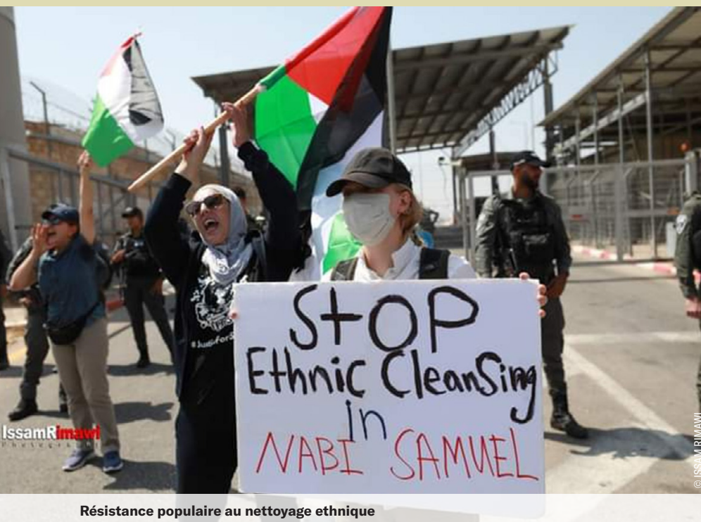
Résistance populaire au nettoyage ethnique

particulièrement de sources. Pendant la période ottomane, c'était une zone de production agricole très riche.